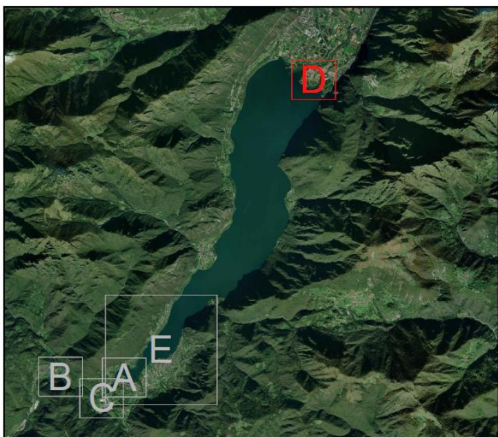
Figura 1 – Posizione della ZSC-ZPS rispetto all'area di intervento.

Nella Relazione di ottemperanza alle prescrizioni, PE-000-INQ-GE-003-RO-B, nella versione integrata, in primo luogo il proponente ricapitola le prescrizioni progettuali tecniche impartitegli e dà atto di averne tenuto conto sia all'interno della prima progettazione esecutiva del 2018, che in quella successiva di aggiornamento del progetto esecutivo del 2022. A seguire (da pag. 71) fornisce una griglia di lettura della documentazione prodotta a dimostrazione dell'ottemperanza alle varie condizioni, come sopra indicata, evidenziando anche le modifiche introdotte in sede di integrazioni spontanee.